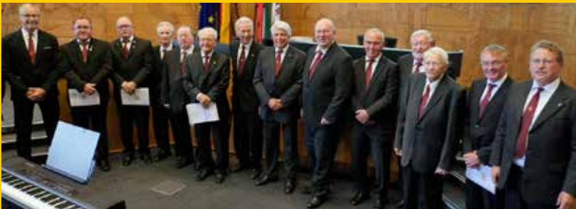
MGV Liederkranz 1903 Düsseldorf-Hamm und Männerchor Himmelgeist Erholung 1908