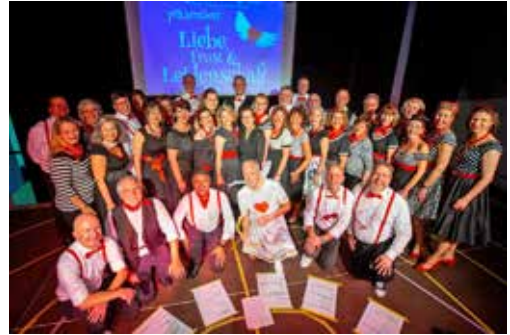
Hildener Chorgemeinschaft am 28. Oktober 2023

Ab Januar 2024 beginnen die Planungen für das nächste Konzert mit Klangcocktails an der Hörbar. Infos: www.hildenerchorgemeinschaft.de . //