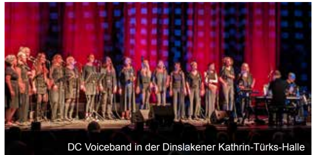
DC Voiceband in der Dinslakener Kathrin-Türks-Halle

der, wie die NRZ anschließend berichtete, „seine Entertainerqualitäten als Pianist, Dirigent, Sänger und Moderator“ ausleben konnte.