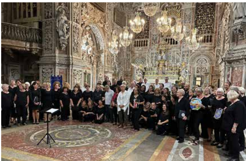
Projektchor des Chorverbandes Düsseldorf in der Kirche St. Catarina in Palermo.

chen landschaftlichen Ausblicken zu genießen. Der Ätna hatte sich leider in Wolken gehüllt.