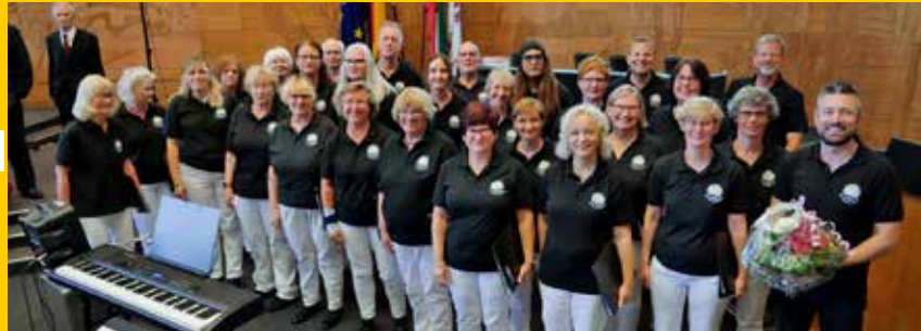
Chorraga der Polizei Düsseldorf