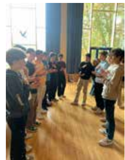
Schüler*innen beim „Vocal Painting“-Workshop.

In einer kurzen Reflektionsrunde äußerten sich die Schüler*innen zu ihrer Darbietung und zeigten sich sehr beeindruckt davon, wie schnell und mit wie wenigen Mitteln man in einer großen Gruppe gemeinsam ‚coole‘ Musik mit Hilfe der Stimme machen kann, weiterhin, dass sie größeres Zutrauen in sich gewonnen haben, vor einer großen Gruppe musikalisch selbstverantwortlich zu agieren. //