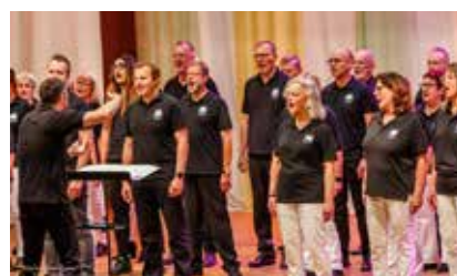
Chorraage der Polizei Düsseldorf

Nach dem Sommer kommt der Winter – zumindest bei den Konzerten von Chorraage. Wir laden daher an dieser Stelle herzlich ein zum Konzert im Advent unter dem Motto „Can You Hear the Angels“ am Samstag, 16. Dezember 2023 im Festsaal der Rudolf-Steiner-Schule. Wir freuen uns, Sie begrüßen zu dürfen! //