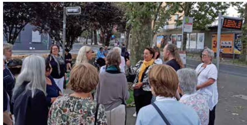
„DIVA“-Sängerinnen beim Chorspaziergang am Mintrop-Platz

Am 16. August war es dann so weit. Treffpunkt und Einsingen erfolgte im „zentrum plus“ der AWO Stadtmitte. Den Auftakt des Chorspazierganges machte der Chor „DIVA“ (Düsseldorfer Impro Voices). Aufgrund umfangreicher Werbung durch Aushänge und Artikel in der Lokalpresse fanden sich bereits hier zahlreiche Besucher*innen ein, die den Spaziergang zum Mintropplatz begleiteten. Mitten im Kiez, vom Feierabendverkehr völlig unbeeindruckt, gaben die Sänger*innen von DIVA ihr kleines Konzert. Zahlreiche Passanten gesellten sich rasch dazu, staunten nicht schlecht und wanderten mit zum nächsten Auftrittspunkt am Stresemannplatz.