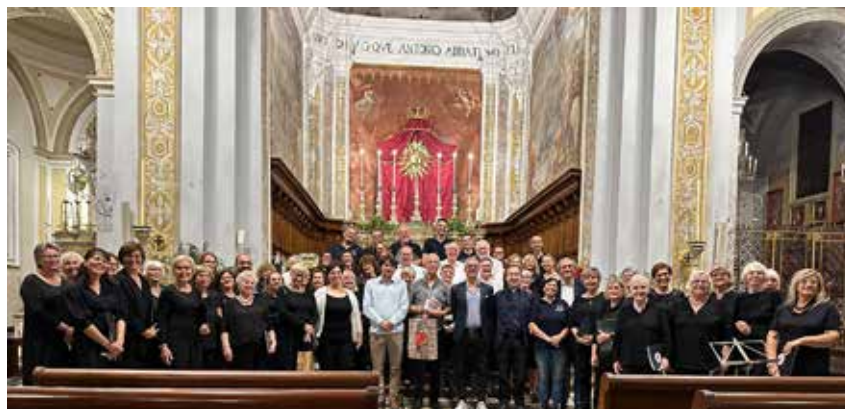
Sänger*innen des Chorverbandes Düsseldorf in der Chiesa Madre in Acì Sant’Antonio.

Auf der Weiterfahrt nach Cefalù machten wir Stopp in Taormina, um dort das griechische Theater zu besichtigen, aber auch einige Zeit die Atmosphäre dieses Ortes mit herrli-