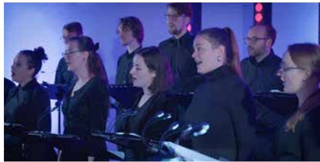
junger kammerchor düsseldorf beim „neuland“-Konzert.

Elektronik verschwommen waren. Über die Chorkomposition „Fütter mich“, erzählt aus der Perspektive eines datensammelnden Algorithmus entwickelte SERANE zum Abschluss des Abends eine hämmernde und mitreißende Techno-Performance, die Club-Stimmung aufkommen ließ.