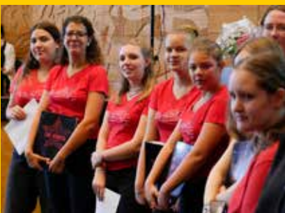
Duisburger Kinder-/Jugendchor „The Voices“