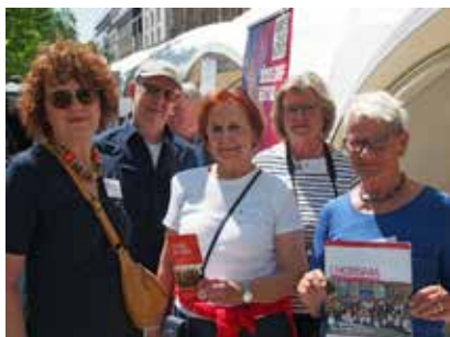
Das ehrenamtliche Vorstandsteam des Chorverbandes Düsseldorf am Infostand.

Fazit: Im Chor waren nicht alle glücklich mit dem Auftritt. Aber das Publikum war zufrieden, und darauf kommt es an. Wir haben andere Menschen erreicht, als mit klassischen Auftritten. Und wir hatten unseren ersten erfolgreichen Auftritt nach der Pandemie. Gerne wieder mal. Jetzt wissen wir auch, dass wir es als kleines Abenteuer sehen müssen. //