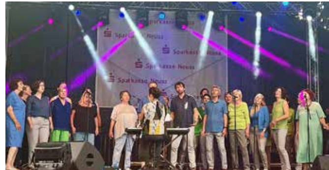
Jazz- und Popchor Meerbusch beim Festival Kaarst Total 2023

Unsere Chorleiterin sollte recht behalten. Aufgrund der Mikrofone