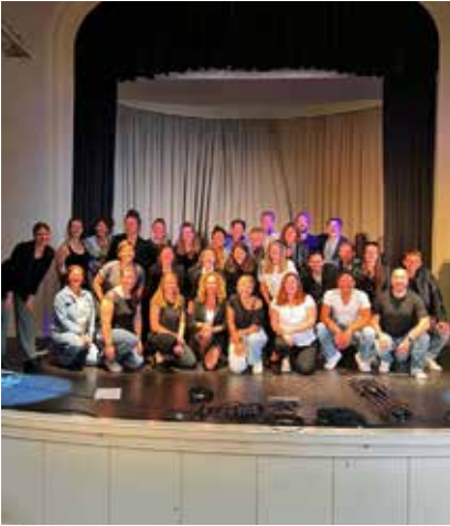
Chorify und Essenzen beim Chorwochenende in Bremerhaven.

durch den Raum, Tschakkas und ein Urschrei waren auch dabei. Neben den Bauchmuskeln wurden so auch die Lachmuskeln aktiviert.